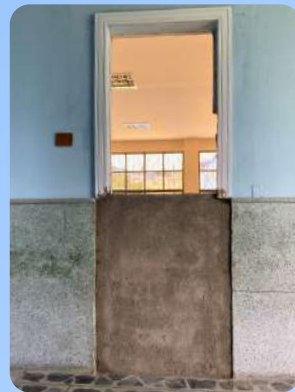
Zona paso a estadio Bachillerato

Recuerde que, si identifica peligros dentro de la Institución, puede reportarlos a través del formato DI-FO016 – Reporte de Incidentes y Condiciones Inseguras. Este procedimiento nos permite implementar controles oportunos para prevenir riesgos y evitar la ocurrencia de accidentes.