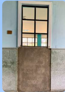
Zona paso a estadio Bachillerato

Recuerde que, si identifica peligros dentro de la Institución, puede reportarlos a través del formato DI-FO016 – Reporte de Incidentes y Condiciones Inseguras. Este procedimiento nos permite implementar controles oportunos para prevenir riesgos y evitar la ocurrencia de accidentes.